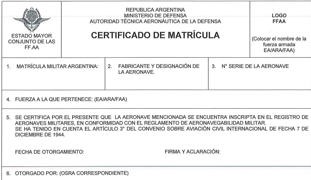
Figura 1 - Certificado de Matrícula

(a) Los Certificados de Matrícula deberán completarse según lo indicado en la sección 90 de esta Orden.